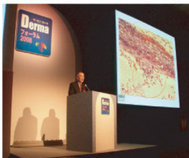
ヤンセンファーマDermaフォーラム講演の様子