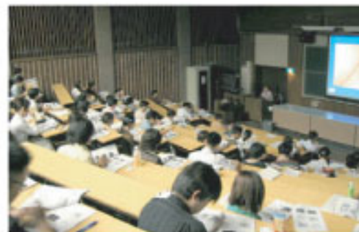
2007年開催皮膚病理講座基礎編の様子

日時 2008年9月14日 (日) 9時~13時 懇親会 19時~21時 9月15日 (月・祝) 9時~13時