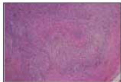
皮下に結節状病変がある。

60才、女性 生検部位： 手掌部から手背 臨床診断：皮下腫瘍（手） 病理組織診断：Rheumatoid nodule