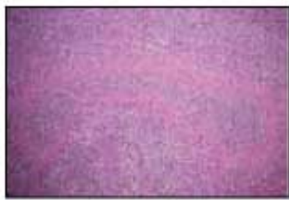
均一な好酸性物質の周囲には著明な炎症性細胞浸潤がある。