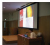
1 第15回札幌皮膚病理セミナー