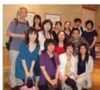
送別会での集合写真です